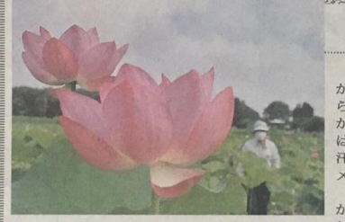
休耕田で見頃を迎えたハスの花