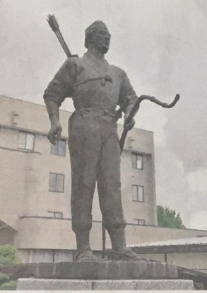
郷土発展の願いなどを込めて建立された「幸矢の与一像」